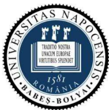
Universitatea "Babeș-Bolyai" din Cluj-Napoca, România