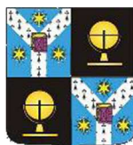
Departamentul de Geografie, Facultatea de Geografie și Geologie Universitatea "Alexandru Ioan Cuza" din Iași, România