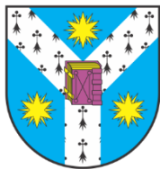
Universitatea "Alexandru Ioan Cuza" din Iași, România